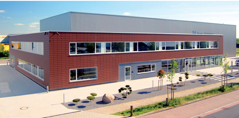
Der 2008 gebaute Firmensitz von Mager & Wedemeyer